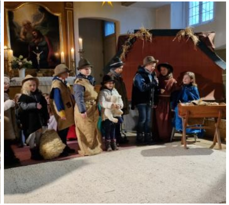
Krippenspiel in der Marienkirche in Großhaslach