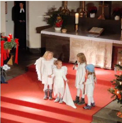
Krippenspiel in der Martinskirche in Bruckberg

Die Kinder, die Teams und alle Helfer schaffen es jedes Jahr unsere Herzen zu erwärmen: Vielen Dank eure Zeit & Engagement! Es hat die Gottesdienstbesucher erfreut, bewegt und Licht gebracht.