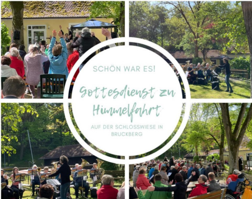
Unten: Gemeinsamer Godi an Himmelfahrt in Bruckberg.

SCHÖN WAR ES! Gottesdienst zu Himmelfahrt AUF DER SCHLOSSWIESE IN BRUCKBERG