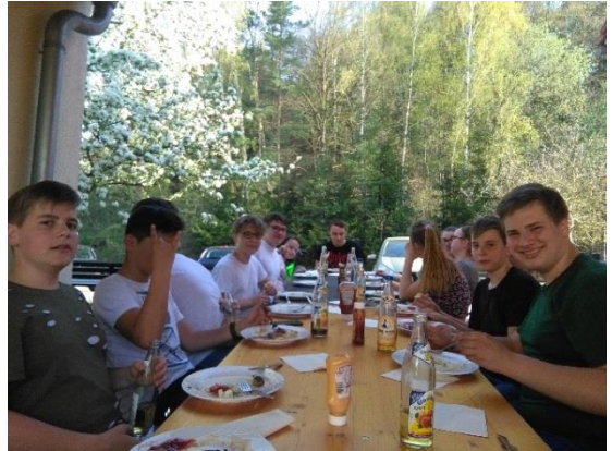
Bild: „Endlich ist es wieder Sommer!“ – Superkonfis, Präpis und Freunde beim Grillen am Jugendraum im Gemeindetreff...